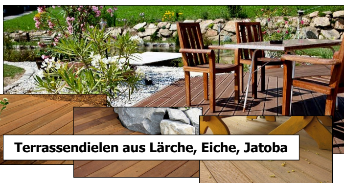
Terrassendielen aus Lärche, Eiche, Jatoba

Alle Produkte können auch mit Montage angeboten werden!